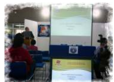
La importancia de pertenecer a Organizaciones Profesionales