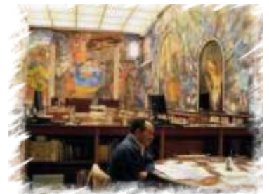
Biblioteca Miguel Lerdo de Tejada Un Recinto Ideal para La Investigación