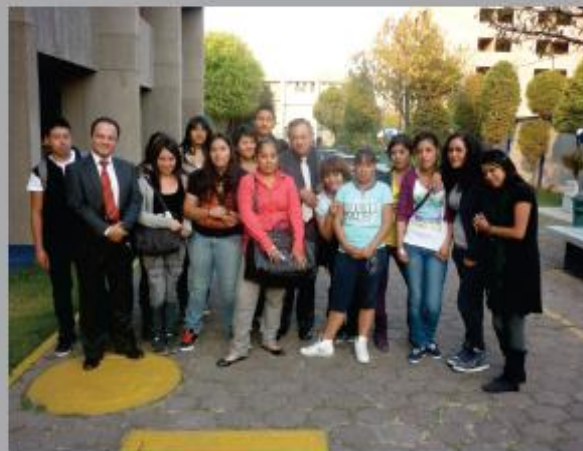
Estudiantes del Colegio de Bachilleres Plantel 18 "Tlilhuaca-Azcapotzalco" de visita en la ENBA

2012 será un año de grandes retos en materia de difusión, que solo con la participación de toda nuestra comunidad podremos superar.