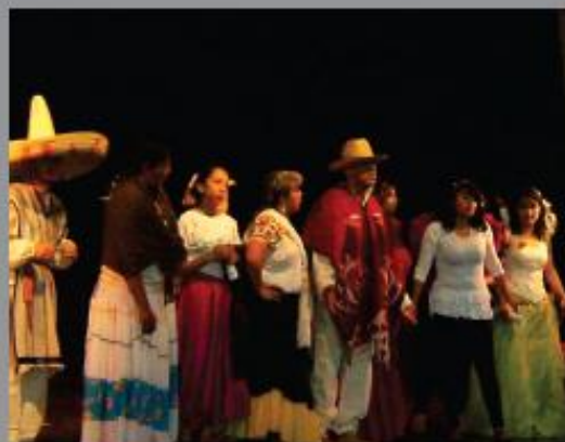
Festival Navideño de la ENBA, en la Biblioteca Vasconcelos