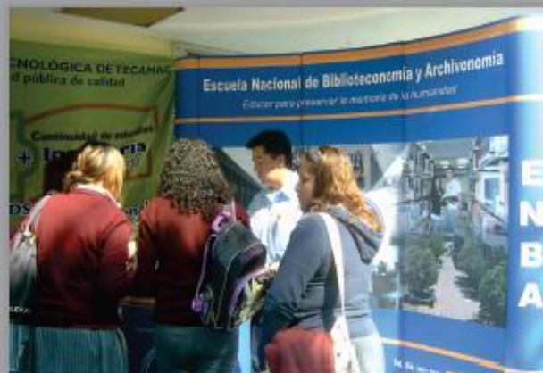
Participación de la ENBA en exposiciones profesiográficas organizadas por Instituciones de Educación Media Superior