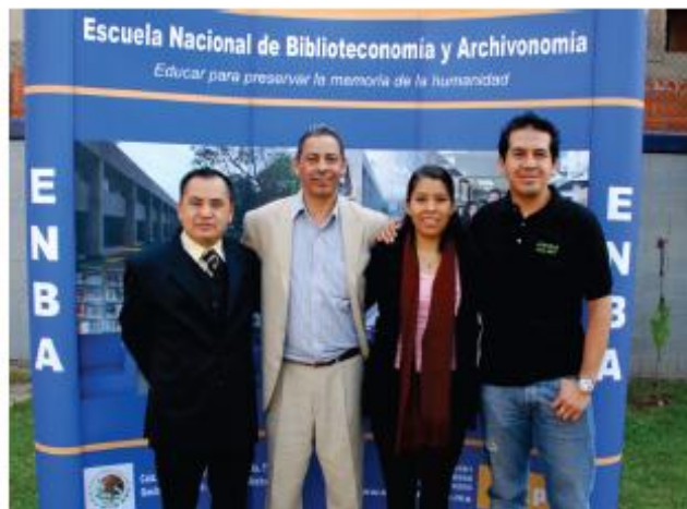
Miembros de diversas generaciones se dieron cita en la Reunión de Ex Alumnos de la ENBA