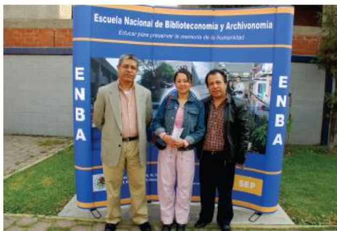
Ex alumnos de la ENBA