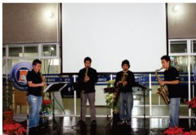
Quadrivium S.A. de T.B. Cuarteto Mexicano de Saxofones