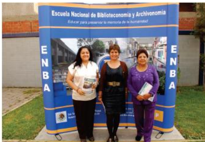
Ex alumnas de la ENBA