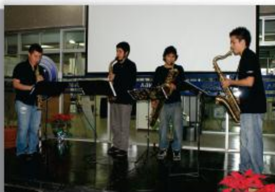
El quinteto de saxofones Quadrivium S.A. de T.B amenizó la reunión de ex alumnos de la ENBA