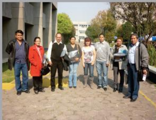
Directivos y bibliotecarios de la Escuela Normal Urbana de Cuautla, Morelos, visitan las instalaciones de la ENBA